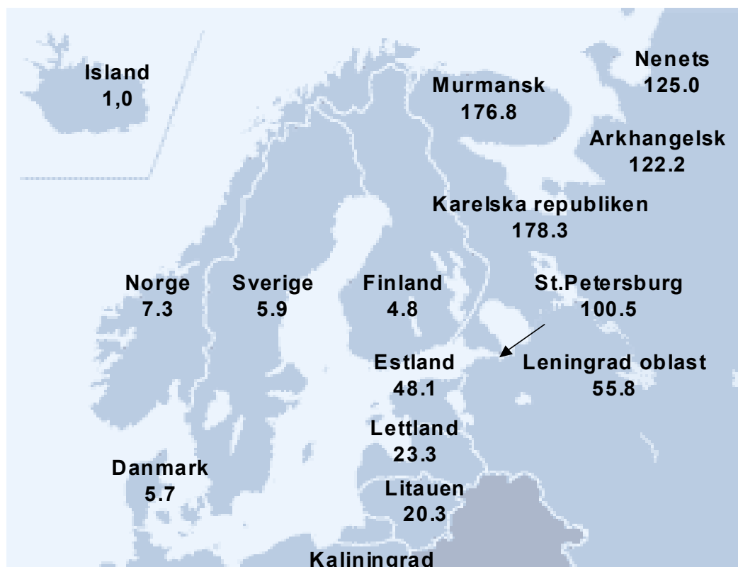
Figur 1. Rapporterade fall av gonorré per 100 000 invånare under år 2001 inom Östersjöregionen (1).* under år 2000.

Den höga gonorréförekomsten i nordiska länders närområden har skapat oro för risken av ökad import av gonorré över landgränserna. Detta har man till en viss grad iakttagit i Finland. Under år 2000 konstaterades de flesta av de 287 rapporterade fallen av gonorré i Finland nära den östra gränsen i Södra och Norra Karels sjukvårdsdistrikt. Av de smittade var 77 % män och varannan smittades utomlands. I 48 % av fallen härstammade smittan från Ryssland och i 19 % från Thailand (2). Både i Sverige och i Norge rapporteras varje år en handfull heterosexuella män som är smittade i Ryssland och de baltiska länderna, medan Thailand dominerar som smittland för de utlandssmittade (se Halvårsstatistik för gonorré). Danmark rapporterar få fall av importerad gonorrésmitta från samma områden (3).